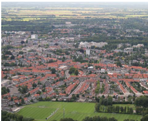
Almelo vanuit de lucht. Onze stad kenmerkt zich door een gevarieerd en bijzonder bomenbestand. De Gemeente heeft de zorg deze kwaliteit voor de toekomst te behouden.

Meldingsplichtig blijven particuliere bomen met een stamdiameter van meer dan 30 cm. op 1,30 m. hoogte of die onderdeel uitmaken van een groep. Een kapvergunning blijft ver-